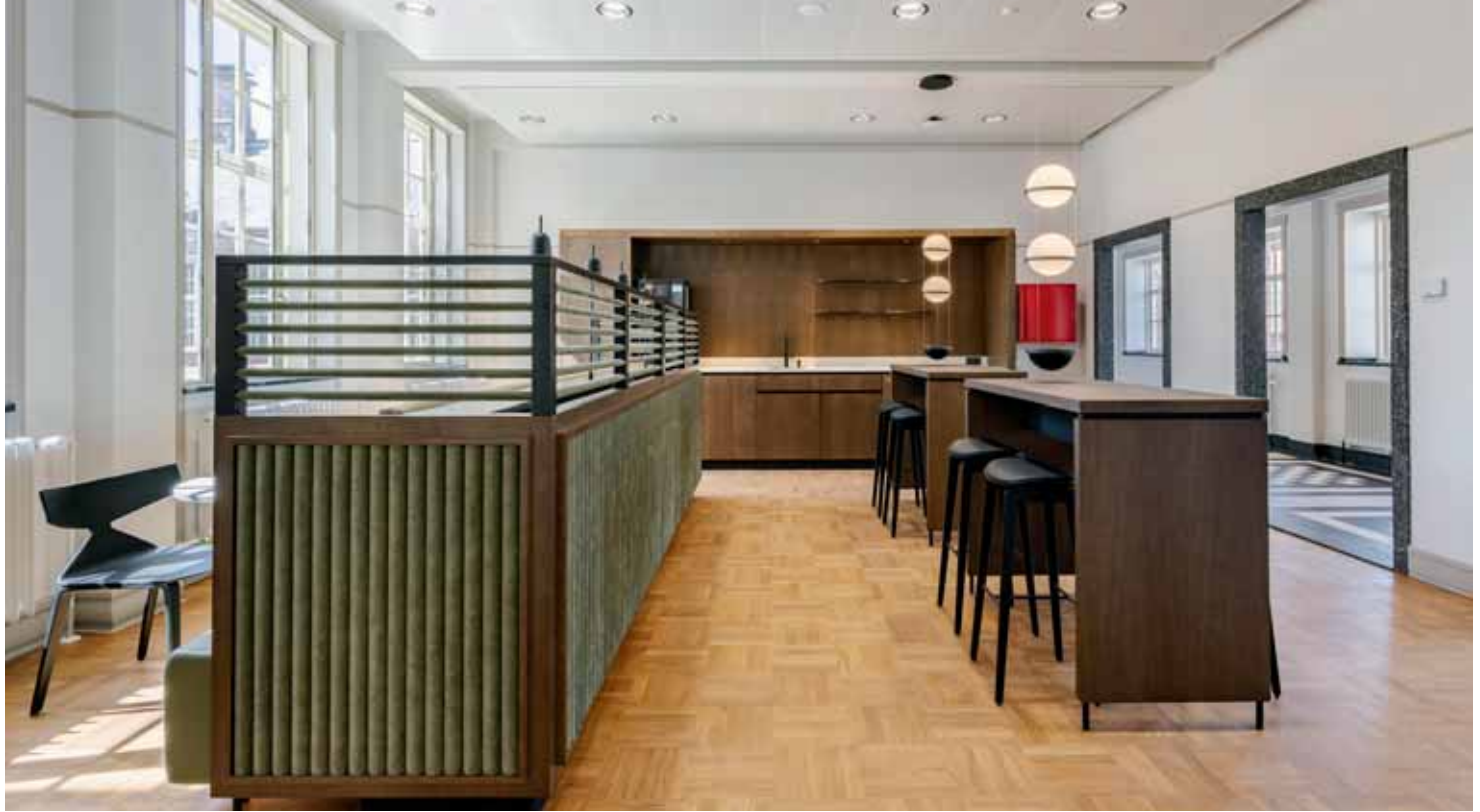
FOTO BOVEN Lunch en overlegruimte op de derde verdieping, met eikenhouten parketvloer en notenhout maatwerk pantry en meubilair.